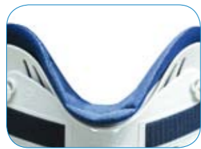
Anatomisch ontwerp verbetert de immobilisatie en pasvorm