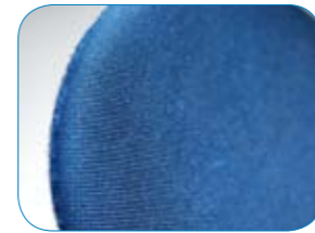
Van Sorbatex polstering is bewezen dat het huidafbraak remt