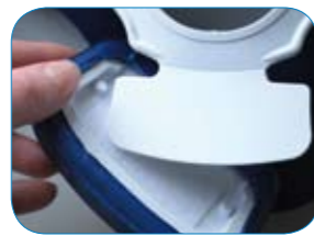
Pad voor het borstbeen kan worden verwijderd voor meer patiëntcomfort