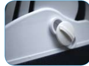
De draaghoekknoppen kunnen worden aangepast om drukpunten te voorkomen